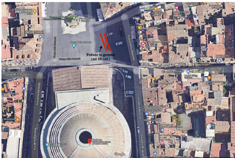
Piazza della Rotonda, Roma

Si specifica a grandi linee che la manifestazione, che speriamo di poter organizzare nel 2024, nel 2025 e anche negli anni a venire, è un evento che in nessun modo può impattare o causare danni alla piazza , la cui durata è attualmente all'incirca di tre ore e mezza , dalle 17:00 alle 20:30, e che richiede solamente un'ulteriore ora per il posizionamento delle pedane e dell'impianto di segnalazione. L'unica altra necessità riguarda un prudente transennamento dell'area antistante, che andrà dunque a delimitare uno spazio di circa 14 metri di lunghezza . Di seguito un cronoprogramma dettagliato della manifestazione utilizzato dal 2020: