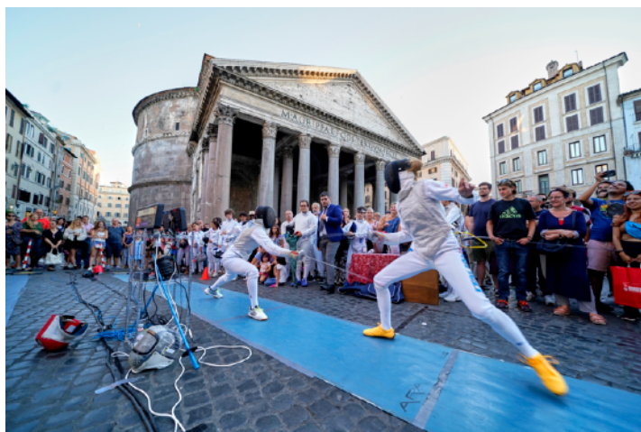
A Fil di Spada XII - 12 settembre 2022 Due schermitrici durante un assalto. A destra, Elisa Di Francisca, ex Campionessa Olimpica di Fioretto (2012)

A Fil di Spada - La Maratona di Scherma - Memorial Enzo Musumeci Greco è la più grande manifestazione schermistica non agonistica in Italia, e prevede esibizioni di Scherma dal vivo fra Campioni del Mondo normodotati e in carrozzina, fra cui anche atleti che hanno sfiorato il podio alle Paralimpiadi di Tokyo 2020 . Nel 2023 siamo arrivati alla XIII edizione della manifestazione e la quarta che si è svolta di fronte al colonnato del Pantheon , in piazza della Rotonda. Si tratta di una manifestazione