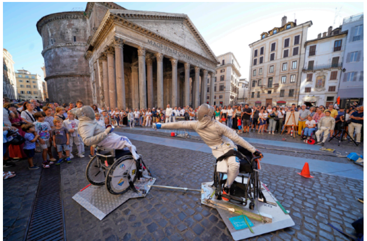
A Fil di Spada XII - 12 settembre 2022 Due atleti paralimpici durante un assalto

Sono ormai quattro anni di fila che la nostra manifestazione A Fil di Spada - La Maratona di Scherma - Memorial Enzo Musumeci Greco si svolge in Piazza della Rotonda, di fronte al Pantheon, con un successo diffuso tramite condivisioni di foto e storie sui social network, articoli e servizi al telegiornale. I protagonisti di entrambe le edizioni sono stati, come sempre, i nostri atleti in carrozzina : la loro abilità in questa disciplina e la spettacolarità delle loro stoccate hanno fatto sì che le manifestazioni fossero davvero indimenticabili, per il pubblico.